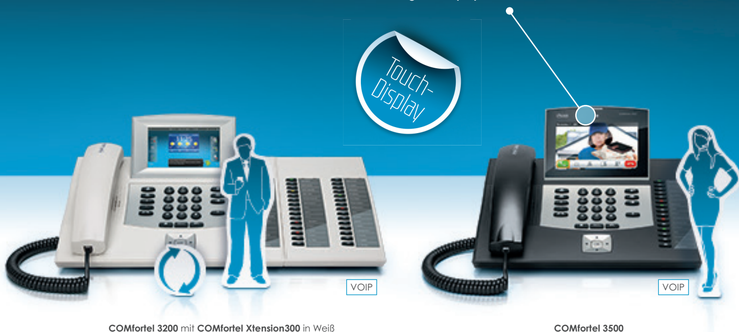
COMfortel 3200 mit COMfortel Xtension300 in Weiß

Ob Sie Anrufer ein Bild zuordnen oder die Türsprechstelle im Auge behalten möchten – das große Display macht sich in vielerlei Hinsicht nützlich.