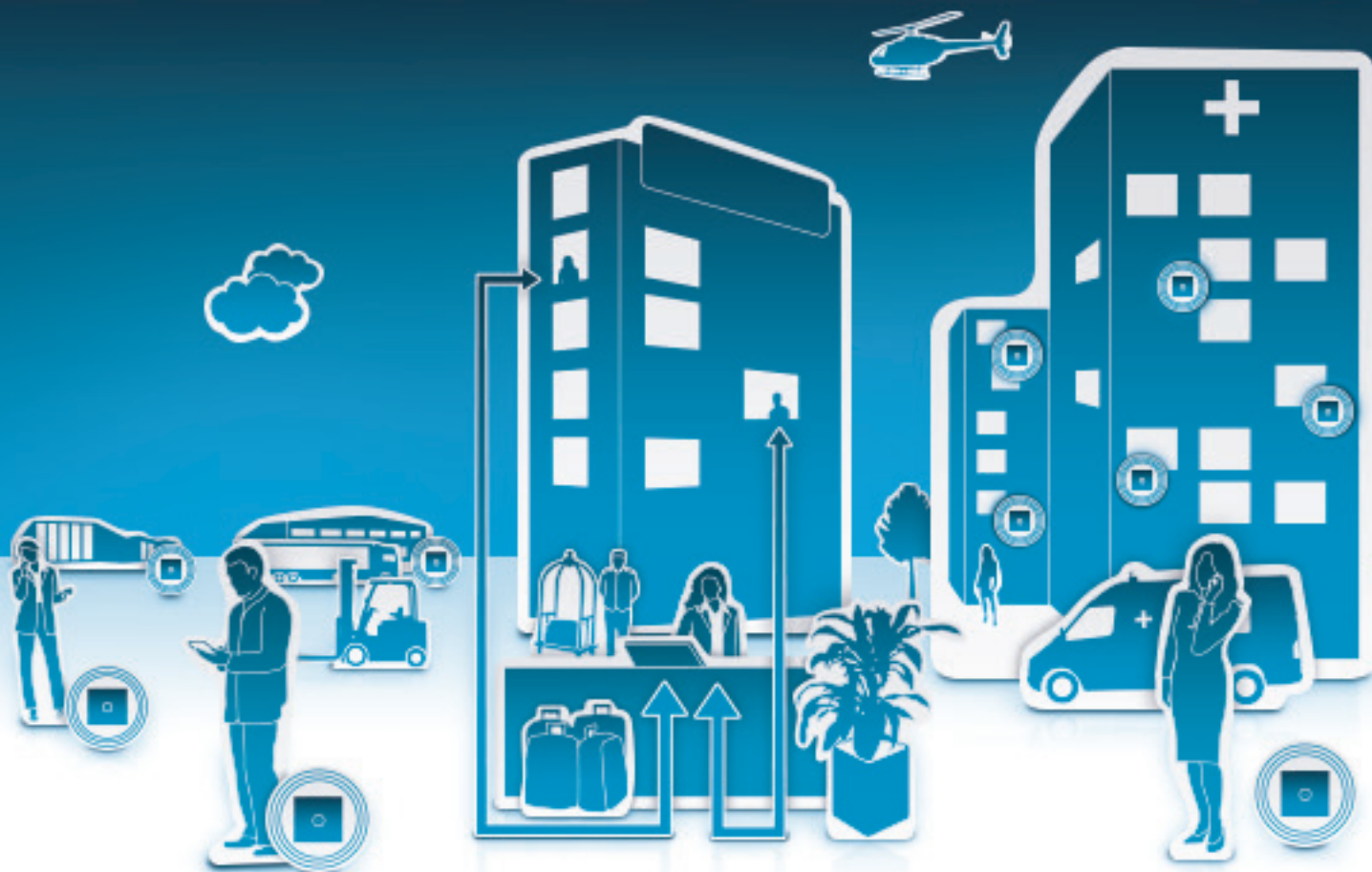
Einkauf, Lager, Fertigung